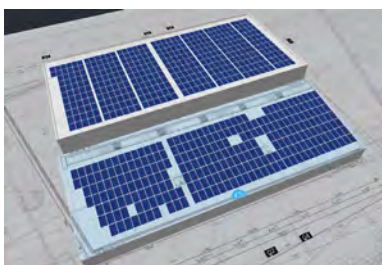
So soll die Sporthalle Sonnenbühl mit PV-Anlage aussehen

Die Energiewende und der Klimaschutz sind keine Sache für ein paar Aktivisten oder „die da oben“, sondern eine gesellschaftliche Gesamtaufgabe. Dass diese Erkenntnis in der Bevölkerung angekommen ist und dass die Umsetzung am besten gelingt, wenn verschiedene Akteure zu-