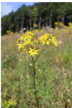
Blühendes Jakobskreuzkraut am Ruchberg in Sonnenbühl-Willmandingen.

Trotz all dieser Vorsichtsmaßnahmen gilt: Kein Grund zur Panik bei gelben Blüten. Man sollte sich stets vergewissern, ob es sich bei der vermeintlichen Giftpflanze tatsächlich um das Jakobskreuzkraut handelt. Verwechslungsgefahr besteht u.a. mit dem Rainfarn oder dem als Heilpflanze genutzten Johanniskraut, welche ebenfalls häufig an Wegrändern und in Straßenböschungen blühen. Weitere Informationen findet man auch unter www.kreuzkraut.de .