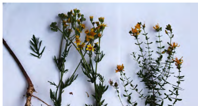
Das Jakobskreuzkraut (links, mit Blatt und Wurzel) kann leicht mit dem ungiftigen Johanniskraut (rechts) verwechselt werden.